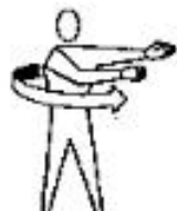
Mova-se a direita