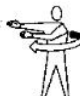
Mova-se a esquerda