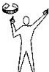
Engrazar o rotor