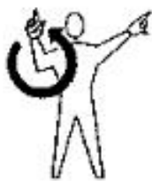
Dê partida nos motores